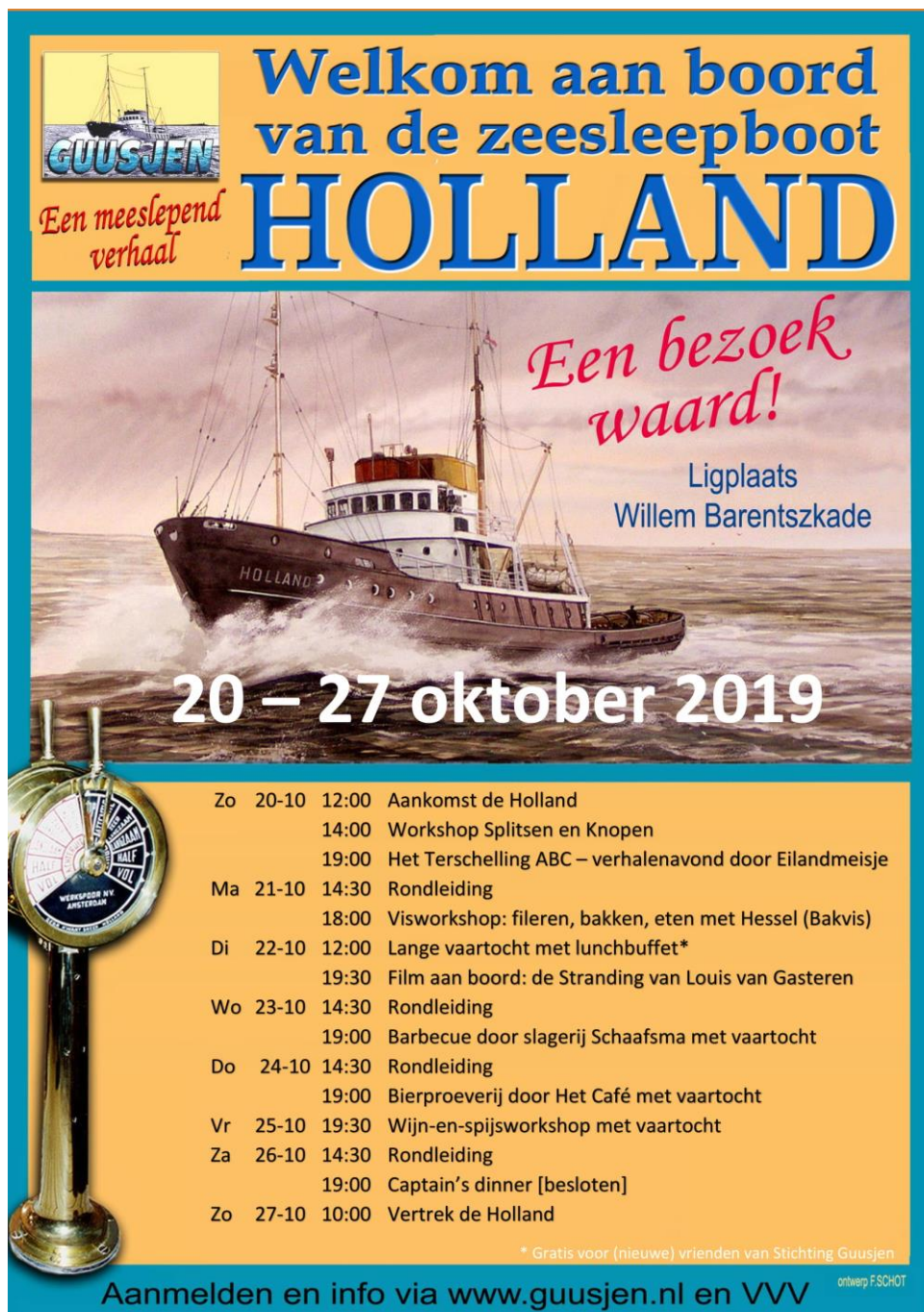
Poster: Programma Guusjen herfstvakantie 2019