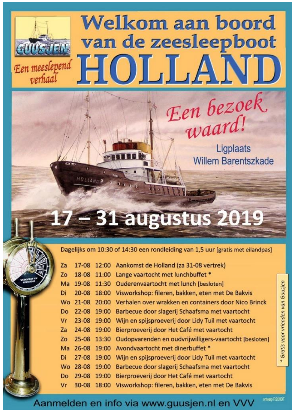
Poster: Programma Guusjen zomervakantie 2019